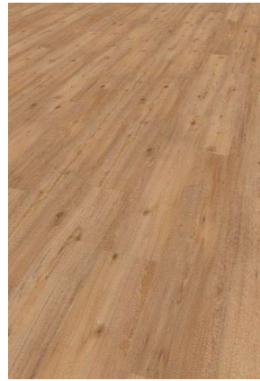
Eiche Fox Nox