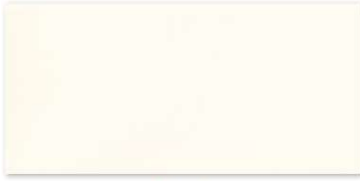
| White | 20 x 50