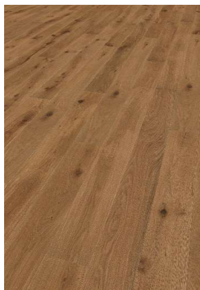
Eiche braun geölt