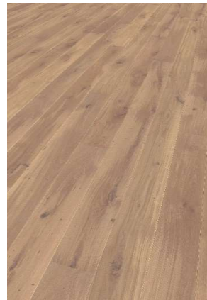
Eiche weiß geölt