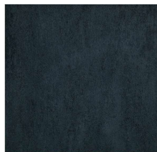
nero - 45 x 45 cm