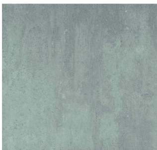
grigio - 45 x 45 cm