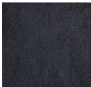
fango - 45 x 45 cm