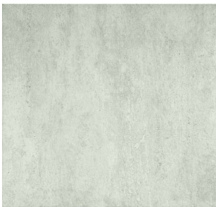
bianco - 45 x 45 cm