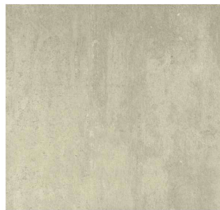
beige - 45 x 45 cm