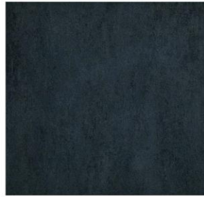
nero - 45 x 45 cm