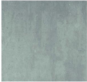
grigio - 45 x 45 cm