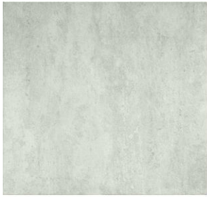
bianco - 45 x 45 cm