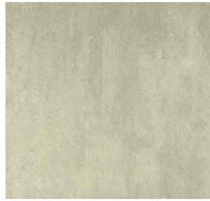
beige - 45 x 45 cm