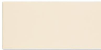
| Bone | 20 x 50