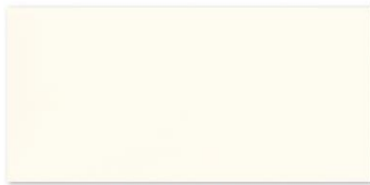
| White | 20 x 50