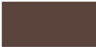
| Moka | 20 x 50