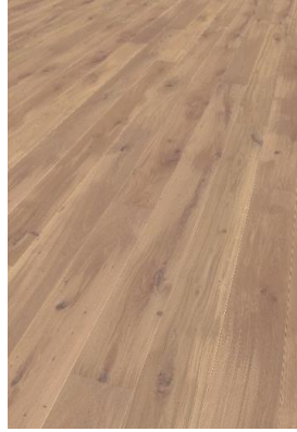
Eiche Natur (geölt oder lackiert)