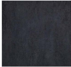
fango - 45 x 45 cm