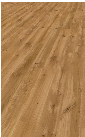
Eiche Natur (geölt oder lackiert)