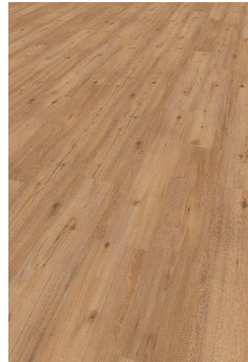
Eiche Fox Nox