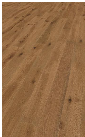
Eiche braun geölt