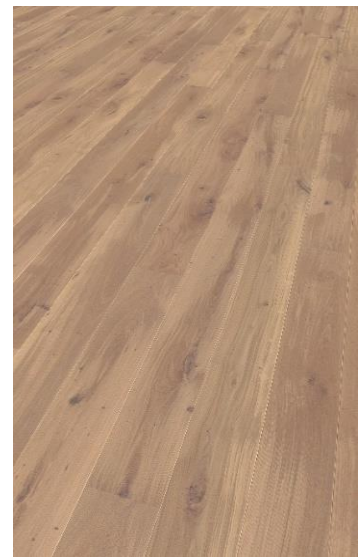
Eiche weiß geölt