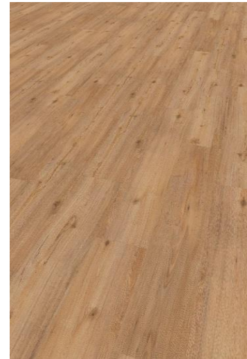
Eiche Fox Nox